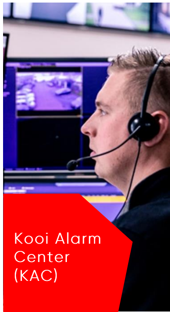
Kooi Alarm Center (KAC)